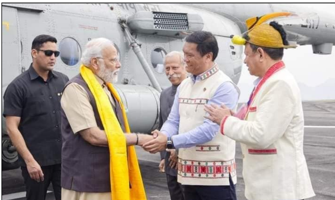
কঁকাল পোনাই অৰুণাচললৈ প্ৰধানমন্ত্ৰীক উষ্ম আদৰণি মুখ্যমন্ত্ৰী পেমা খাণ্ডুৰ