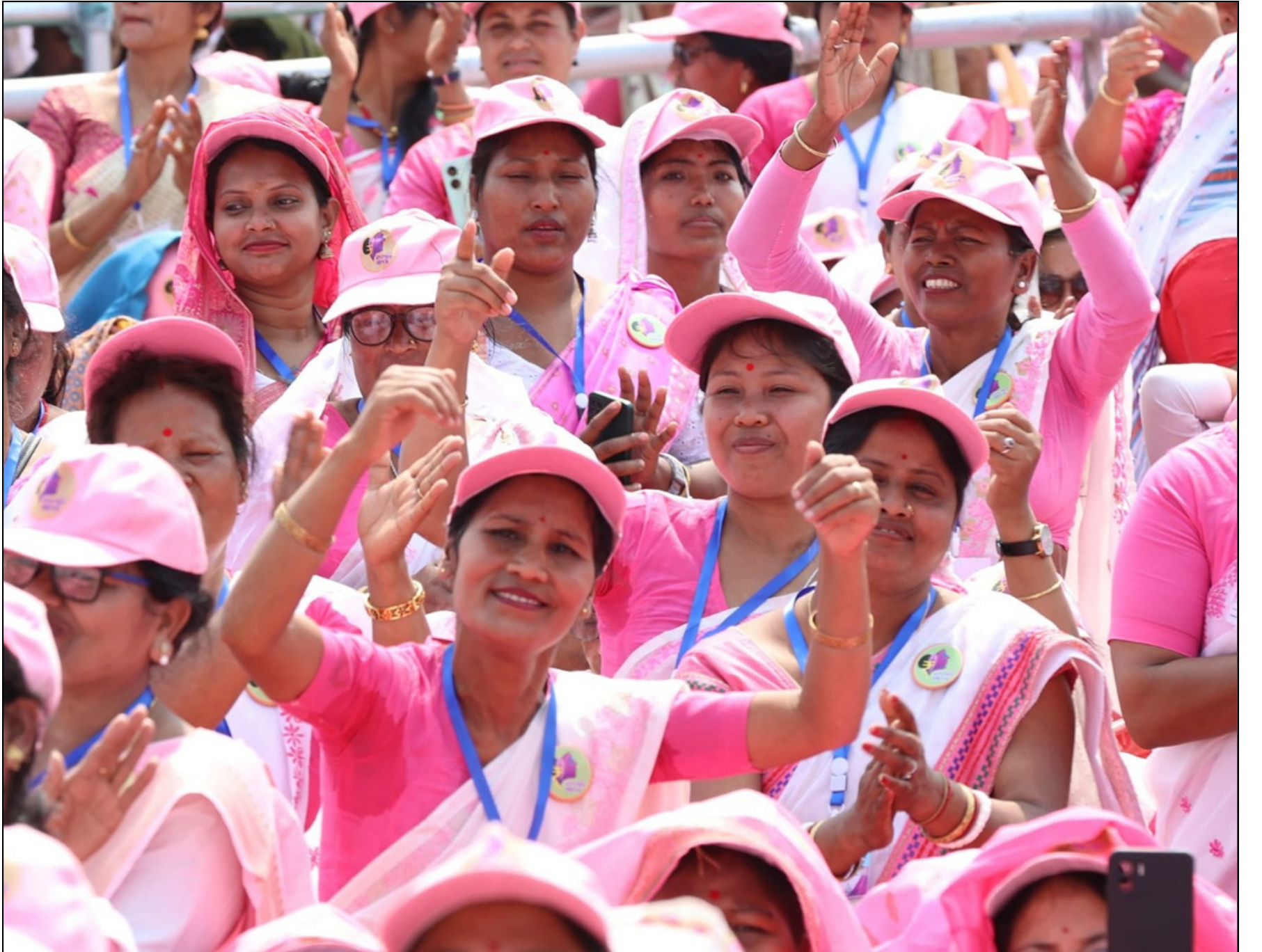
যোৰহাটৰ মেলেং মেটেলীত প্ৰধানমন্ত্ৰী মোদীৰ সভাত অসমৰ লাখপতি বাইদেউসকল